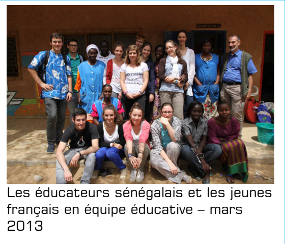
Les éducateurs sénégalais et les jeunes français en équipe éducative – mars 2013